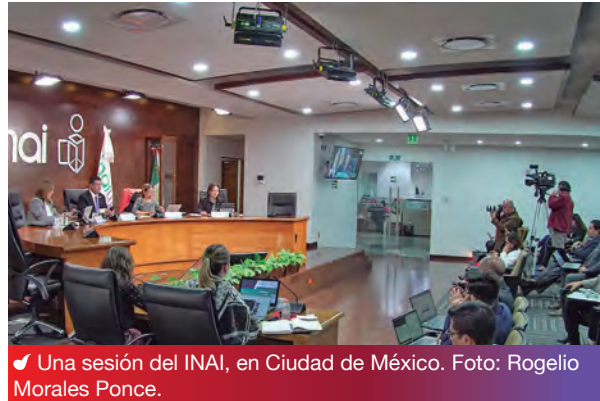
Una sesión del INAI, en Ciudad de México.

Recordemos que ahora esta responsabilidad está en manos de la Secretaría Anticorrupción y Buen Gobierno liderada por la secretaria Raquel Buenrostro. Hoy, la sociedad mexicana sin importar su experiencia en temas jurídicos o administrativos, necesita comprender la importancia de estos cambios en beneficio de sus